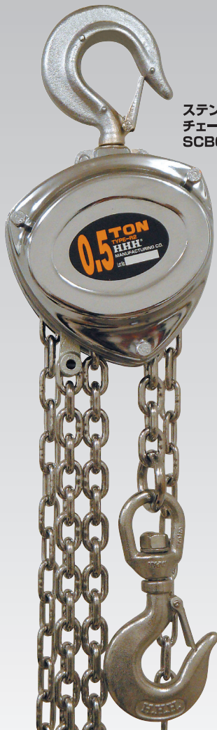
ステンレスチェーン チェーンブロック SCB0.5t