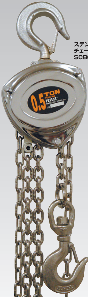
ステンレスチェーン チェーンブロック SCB0.5t